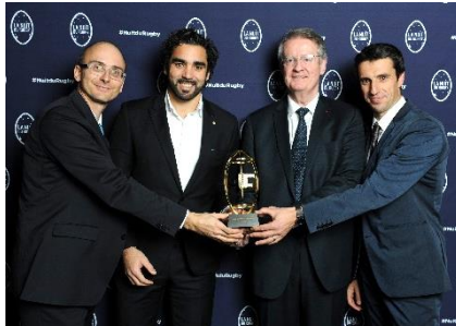
Yoann HUGET Meilleur joueur international français