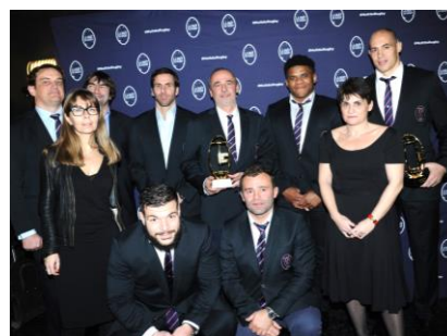
Stade Français Paris Champion de France de TOP 14