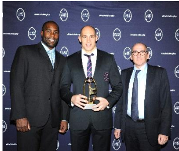
Sergio PARISSÉ Meilleur joueur de TOP 14