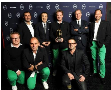
Section Paloise Béarn Pyrénées Meilleur staff d'entraîneurs PRO D2