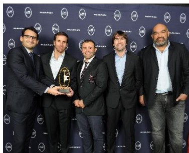
Stade Français Paris Meilleur staff d'entraîneurs TOP 14