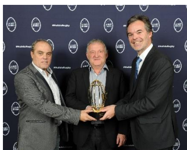
Section Paloise Béarn Pyrénées Champion de France de PRO D2