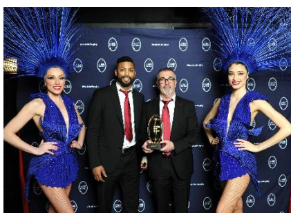
RC Toulonnais Champion d'Europe