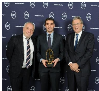
Jérôme GARCÉS Meilleur arbitre