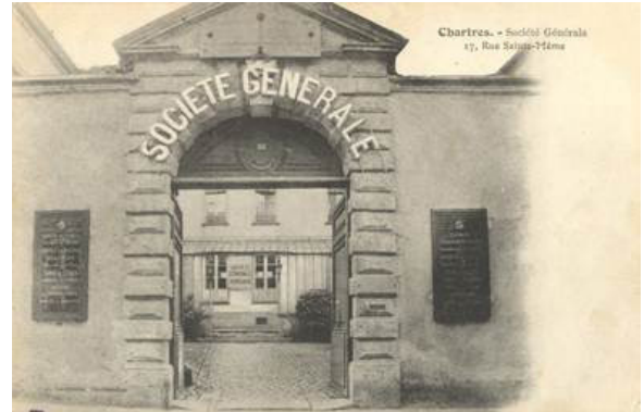
Agence principale de Chartres, rue Saint-Même, au début du XX e siècle